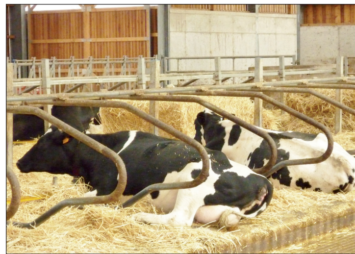
Le bien-être des animaux soutenu par la région Grand est

Comment faire la demande ? Les éleveurs intéressés doivent remplir un dossier. Au préalable, une lettre d'intention doit être adressée à Monsieur le Président de la Région Grand-Est à Châlons-en-Champagne. Vous pourrez démarrer vos travaux dès lors que vous aurez reçu l'accord par un accusé réception de votre courrier. Il n'y a pas de date limite de dépôt de ce dossier. Cependant attention... vous ne pourrez pas déposer une demande