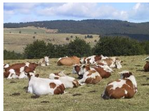
Baisse de la productivité laitière liée à la sécheresse

Les excédents bruts d'exploitation sont en baisse sur les trois systèmes mais se maintiennent à un niveau supérieur à 2016. L'impact de la sécheresse sur l'EBE est d'autant plus marqué dans les exploitations où la part de l'élevage est importante. La sécheresse a fortement freiné la légère embellie de 2017. Le redressement des trésoreries espéré en début d'année 2018 n'est pas arrivé et laisse les éleveurs inquiets. La succession des épisodes de sécheresse et de canicule doit nous amener à réfléchir la sécurité fourragère à apporter dans nos exploitations.