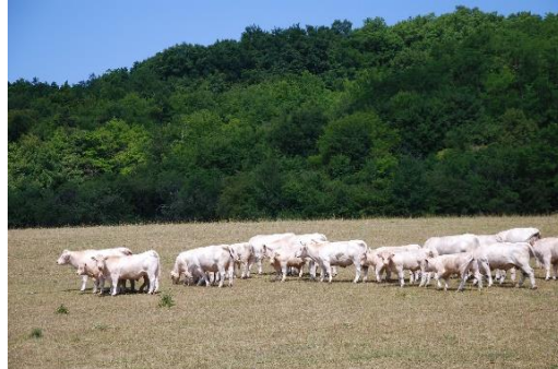
La sécheresse a fortement pénalisé la saison de pâturage

Les conseillers des Chambres d'agriculture du Grand Est et l'Institut de l'Élevage ont simulé, sur quelques systèmes représentatifs de la région, l'impact des conjonctures et aléas climatiques de l'année, afin d'estimer les revenus 2018.