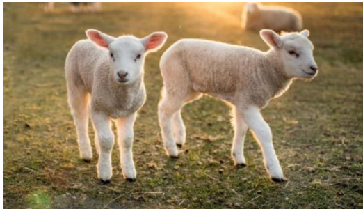
Par manque d'herbe, les quantités de concentrés ont explosé

Pour les systèmes de polyculture élevage, l'EBE poursuit son redressement dans le cas d'atelier cultures comprenant des cultures d'hiver et de l'orge de printemps (hausse d'environ 15% par rapport à 2017 en système bovins viande). Les assolements avec des cultures d'été (maïs grains ou tournesol) sont très fortement pénalisés.