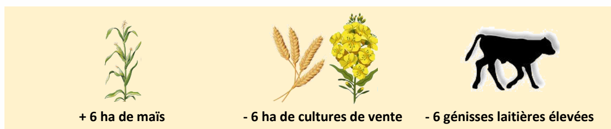
Tableau 4 : Évolution sur l'utilisation des surfaces fourragères et résultats économiques attendus, en comparaison avec la situation à court terme